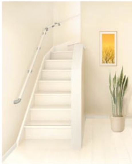
クリエイティブ クリエホワイト

本物の木のような質感を再現。目柄も感触も、まるで本物の木のような質感を再現した高意匠シートを採用。クリエイターの床と揃えてコーディネートすれば、より上質な空間が生まれます。